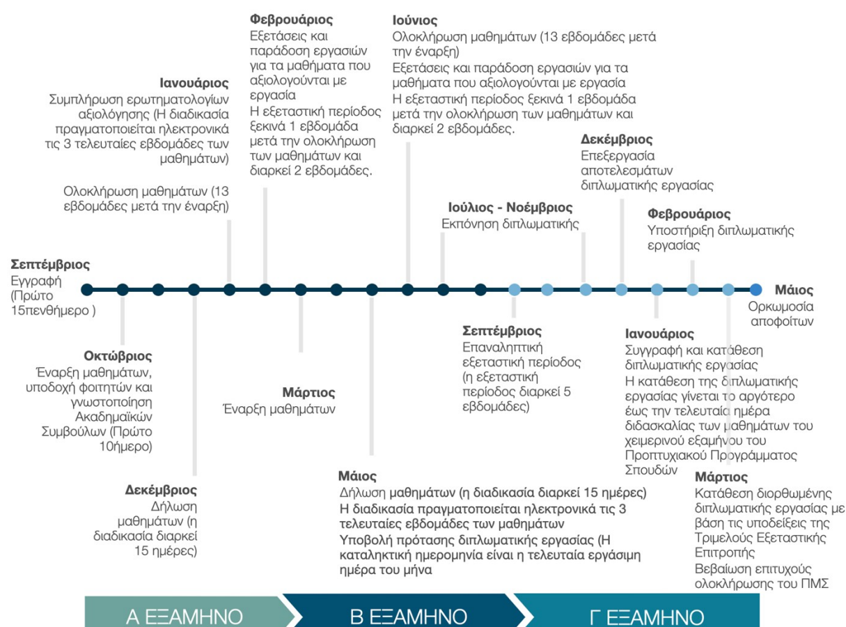
Εικόνα 2. Στάδια και ενδεικτικό χρονοδιάγραμμα φοίτησης και αποφοίτησης από το ΔΠΜΣ

Η έναρξη των μαθημάτων κατά εξάμηνο, ο χρόνος εγγραφών και η εξεταστική περίοδος του ΔΠΜΣ, ακολουθούν τα αντίστοιχα του προπτυχιακού προγράμματος του Τμήματος Κοινωνικής Πολιτικής. Γλώσσα διδασκαλίας στο ΔΠΜΣ είναι η Ελληνική. Τα μαθήματα του ΔΠΜΣ τα οποία έχουν δηλωθεί στο πρόγραμμα Erasmus ότι μπορούν να διδαχθούν στα Αγγλικά θα διδάσκονται στα Αγγλικά εφόσον υπάρχουν μεταπτυχιακοί/ές φοιτητές/τριες Erasmus που συμμετέχουν στο ΔΠΜΣ